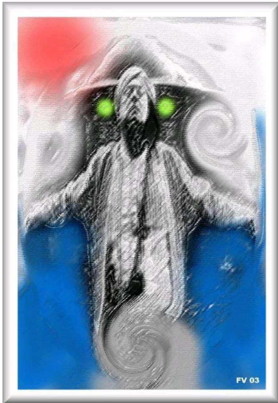
"Assuming Achad" Quadro do Frater Velado exposto na Frater Velado's Art Gallery