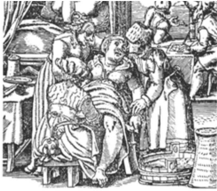
O astrólogo observa o momento exato do nascimento de uma criança para estabelecer seu mapa astrológico

Muita gente acreditava nas previsões astrológicas, consultava astrólogos para tomar decisões da vida cotidiana e recorria aos almanaques astrológicos para saber como ficaria o tempo em determinado dia, ou mesmo para saber quando era aconselhável tomar um preparado de ervas indicado para alguma doença.