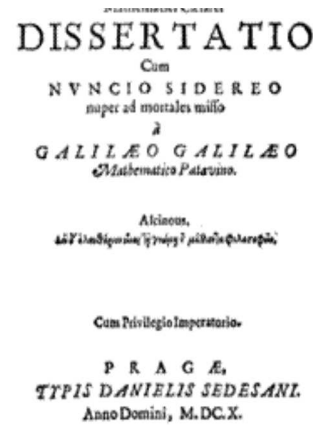
Livro no qual Kepler apresenta sua discussão com Galileu